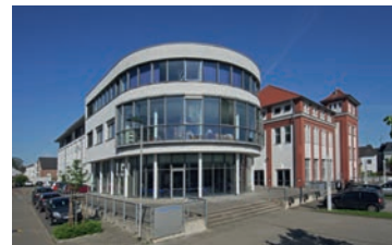
Ihr „Haus der Weiterbildung“, das Weiterbildungskolleg der StädteRegion Aachen, Standort Würselen

Bewerbungsunterlagen sind erhältlich im Sekretariat oder auf der Homepage unter www.wbk-ac.de